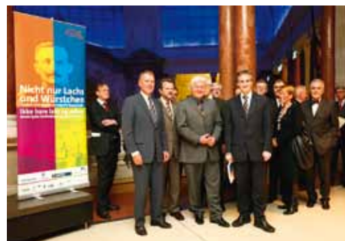
Foto: Utdelingsseremonien for Willy-Brandt-prisen i 2006 fant sted i nærvær av Jonas Gahr Støre og Frank Walter Steinmeier, i forbindelse med åpningen av utstillingen "Ikke bare laks og pølser". / Im Rahmen der Ausstellungseröffnung „Nicht nur Lachs und Würstchen“ wurde der Willy-Brandt-Preis 2006 in Anwesenheit von Jonas Gahr Støre und Frank Walter Steinmeier verliehen.

Prisutdelingen fant sted 10. november 2006 i Kommunikationsmuseet i Berlin. Tysklands utenriksminister Frank Walter Steinmeier og Norges utenriksminister Jonas Gahr Støre delte ut prisen.