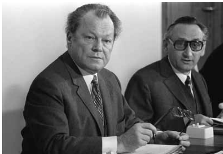
Foto: Brandt og Bahr i stadsråd / Brandt und Bahr im Kabinett, 1972.