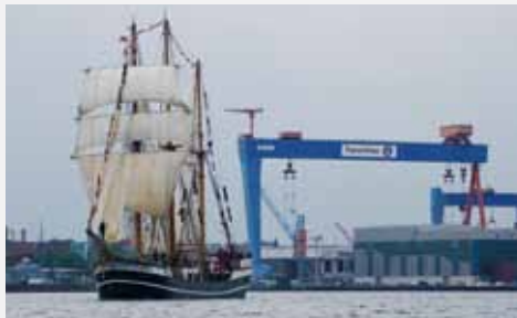
Foto: Seilskipet / Segelschiff „Thor Heyerdahl“.