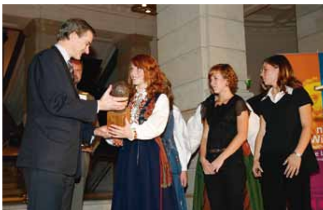
Foto: Jonas Gahr Støre overrekker Willy-Brandt-prise 2006 til elever ved de prisvinnende skolene / Jonas Gahr Støre überreicht den Willy-Brandt-Preis 2006 an Schülerinnen der ausgezeichneten Schulen.

Mit ihrer langjährigen aktiven Arbeit im Schüler-Austausch zwischen Norwegen und Deutschland trugen die drei Schulen zu wachsenden Kenntnissen über die Kulturen beider Länder und damit zu einem größeren Verständnis zwischen Norwegen und Deutschland – auch auf persönlicher Ebene – erheblich bei.