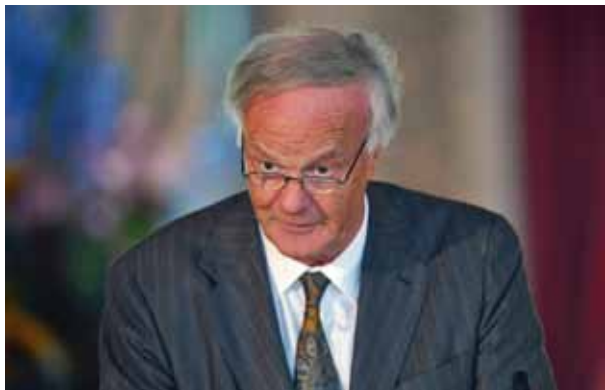
Foto: Sverre Dahl, under utdelingen av Goethemedaljen i Weimar / Verleihung der Goethe-Medaille in Weimar. 2009. © dpa – Report.

Etter hvert har dette arbeidet utviklet seg til et prosjekt. Tysklands-bildet i Norge er, slik jeg ser det, fremdeles sterkt preget av nazitiden. En bølge av filmer og bøker fra og om den-