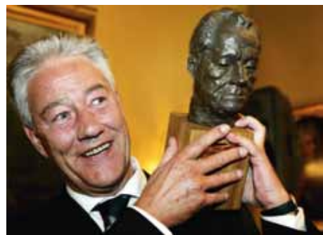
Fotos: Vinnerne av Willy-Brandt-Prisen i 2005 under prisutdelingen i Oslo / Willy-Brandt-Pris-träger 2005 bei der Verleihung in Oslo. oppe / oben: Kåre Willoch med Horst Köhler / Kåre Willoch mit Horst Köhler. nede / unten: Björn Engholm