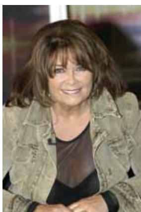
Foto: Vinner av Willy-Brandt-prisen i 2002 / Willy-Brandt-Preisträgerin 2002 Wenche Myhre in Hamburg, 2004.

Prisoverrekkelsen fant sted 27. mai 2007 i Bergen, i de historiske Schøtstuene på "Tyskebryggen". Ministerpresident i Mecklenburg-Vorpommern, Harald Ringstorff, og Norges handelsminister, Ansgar Gabrielsen, stod for utdelingen.