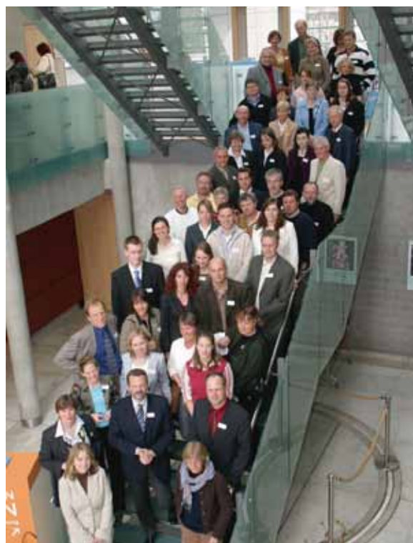
Foto: -Lærer-konferansen i 2006 ble arrangert i samarbeid med Norsk-Tysk Vennskapsselskap / Die Schüler-Lehrer-Konferenz 2006 wurde gemeinsam mit der Deutsch-Norwegischen Freundschaftsgesellschaft e.V. veranstaltet.

I 2004 organiserte Stiftelsen i samarbeid med den tysk-norske parlamentarikergruppen et arrangement med tittelen ”Fra dyp krise til høye svev– hvordan gjennomføre reformer i Skandinavia?”. I 2006 organiserte stiftelsen et arrangement i det tyske arbeids- og sosialdepartementet i Berlin, som bar tittelen ”Hurra, vi lever lenger – men hvordan står det til med sysselsetting av eldre? Hva kan vi lære av de nordiske landene?”. Foran et publikum på over hundre gjester utvekslet arbeidsministrene fra Tyskland, Danmark og Norge og en finsk arbeidsmarkedseksperter erfaringer med yrkesdeltagelse blant personer over 55 år. En videreføring av samarbeidet på dette feltet er allerede planlagt. Mulige fremtidige temaer kan være arbeidsfleksibilitet og -sikkerhet, strategier for arbeidsmarkedet, innen (videre)utdanning, likestilling i arbeidslive, muligheten for å kombinere arbeid og familie og minstelønn i Tyskland og Norge.