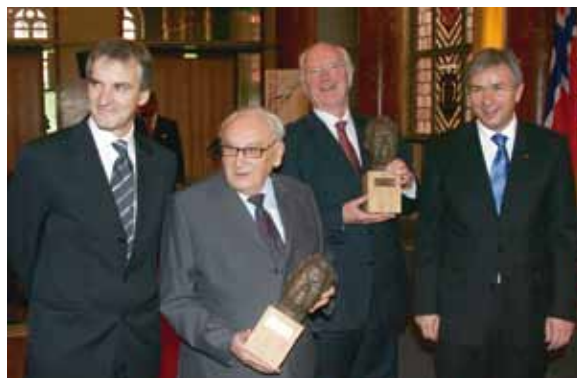
Foto: Vinnerne av Willy-Brandt-prisen i 2007 med prisutdelerne / Willy-Brand-Preisträger 2007 mit Laudatoren. Jonas Gahr Store, Egon Bahr, Thorvald Stoltenberg, Klaus Wowereit (v.l.n.r.)

I 1999 ble det satt i gang arbeid i Utenriksdepartementet der man så på hvordan forbindelsene kunne styrkes og utbygges. Det ga seg uttrykk i en egen norsk Tysklandsstrategi. At man utformet en egen strategi for et land var i seg selv noe nytt. I denne strategien ble det lagt fram forslag om at det skulle etableres en uavhengig norsk-tysk stiftelse.