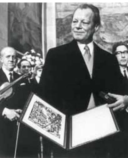
Foto: Willy Brandt, Nobelsfredspris i Oslo / Friedensnobelpreis in Oslo, 1971. © dpa – Bildarchiv.

verbunden Im Geiste Willy Brandts, der die nationalsozialistische Diktatur in Deutschland unter anderem in Norwegen überlebte und von 1940 bis 1948 norwegischer Staatsbürger war, will die Norwegisch-Deutsche Willy-Brandt-Stiftung zur Vertiefung der Beziehungen und zu einem besseren gegenseitigen Verständnis beider Länder beitragen. Sie will Kenntnisse über das gesellschaftliche Leben, die Kultur und die Sprache des jeweils anderen Landes vermitteln und fördert hierzu den Dialog zwischen Gruppen, Bildungsinstitutionen, Nachwuchskräften und gesellschaftlichen Multiplikatoren mit dem Ziel eines nachhaltigen Kontaktes und Erfahrungsaustausches.