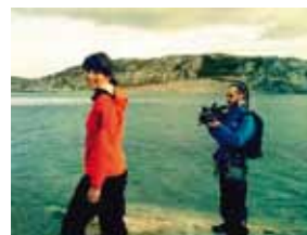
Foto: Et fjernsynsteam fra NRK lager en reportasje om kunstnerduoen SpringerParker / Ein Fernseheteam von NRK berichtet über das Künstlerduo SpringerParker.

Zum zehnjährigen Jubiläum der Norwegisch-Deutschen Willy-Brandt-Stiftung wünschen SpringerParker alles Gute.